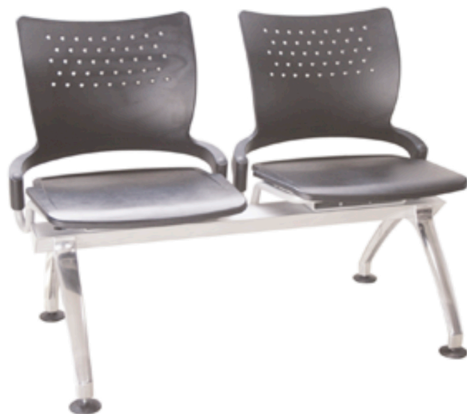
BANCA SAUCO 2