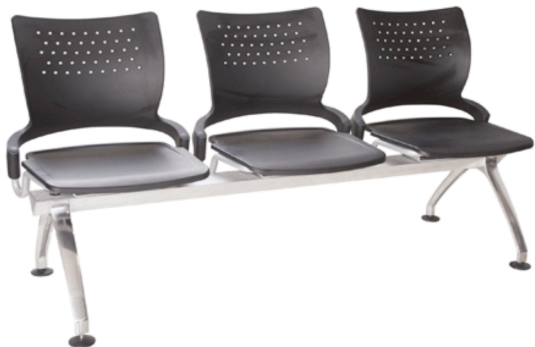
BANCA SAUCO 3